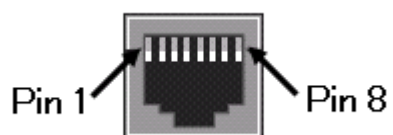
<LANポート 10/100BASE-TX RJ-45>