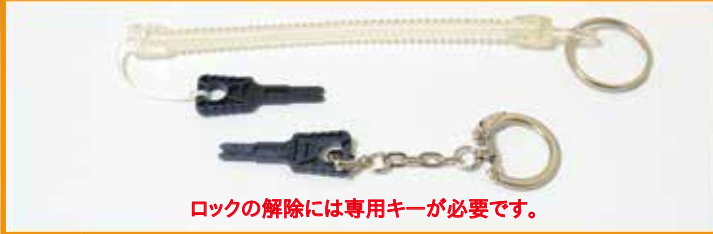
ロックの解除には専用キーが必要です。

専用キーは全てのキーロックで共通です。付属部分はキーホルダーとストラップからお選びいただけます。