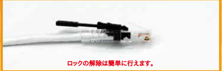
ロックの解除は簡単に行えます。

専用キーは全てのキーロックで共通です。付属部分はキーホルダーとストラップからお選びいただけます。