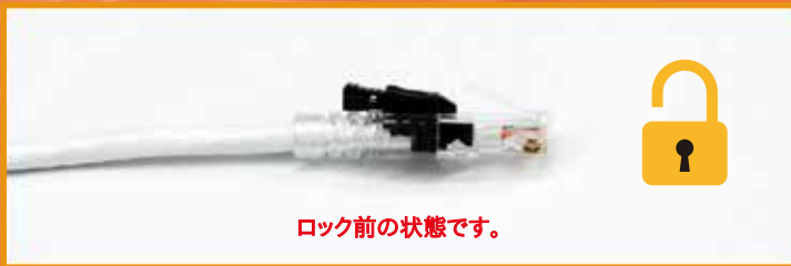
ロック前の状態です。