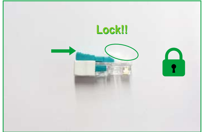
■ ロック状態です。キーロックによりラッチ (爪) 部分が押せなくなり、LAN ポートをしっかり保護します。