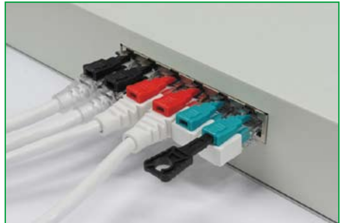
■ 活用例です。使用ポートは【セキュリティロック付き LAN ケーブル】、未使用ポートは【セキュリティポートロック (RJ-45)】により、物理的なセキュリティの向上に役立ちます。