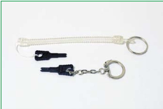
■ ロックの解除には専用キー (別売) が必要です。付属品はキーホルダーとストラップからお選び頂けます。