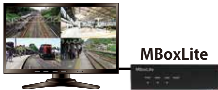
管理センター内モニタ (マルチキャスト)