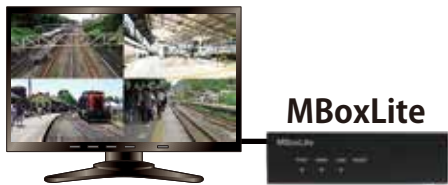
駅構内モニタ (マルチキャスト)