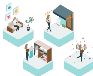
ショッピングモール