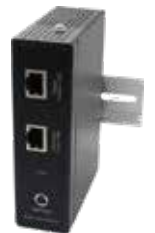
802.3af to 24V PoEコンバータ