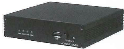
エンコーダ/デコーダ「TCS 8500」