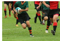
動きの激しい スポーツイベント中継