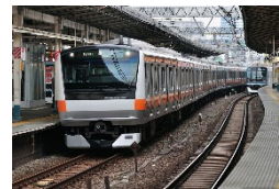
鉄道などの運行情報管理