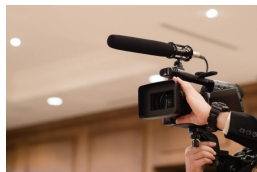
放送素材のバックチャネル・映像確認