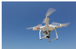
ドローンのプロポ映像伝送