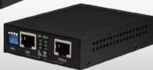
ABiLINX 1003i ▶ (動作温度：-20～+65℃)