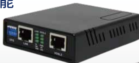
◀ ABiLINX 1003 (動作温度：0～45℃)