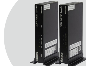
フルHD映像伝送システム WiMi6400T/R