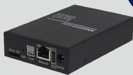
SRT搭載 H.265エンコーダ HTX-E2000NN